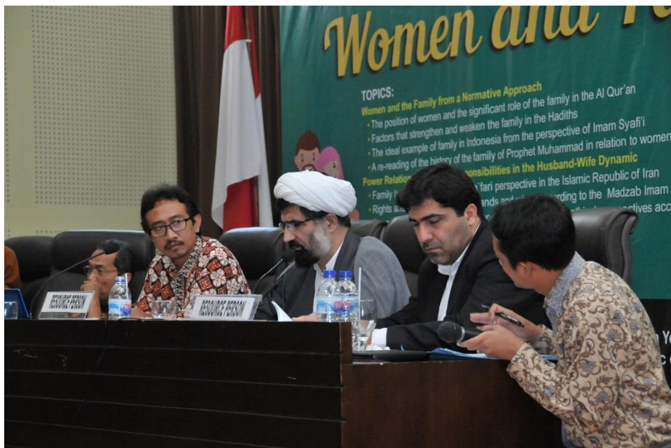
در پایان اساتید ارائه کننده مقاله به بالای سن دعوت شده و زود اعطای هدیه به آنان عکس یادگاری گرفته شد.